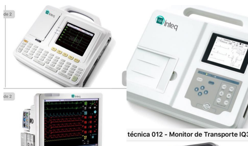
técnica 012 - Monitor de Transporte IQ3

Capacitados para brindar un excelente servicio